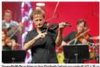
Le groupe Bodie en concert sur l'île de Bréhat.

La famille Souchon ne sera renouvelée, mais tous les jours de jeudi à dimanche, l'île de Bréhat s'ouvrira sur vingt-deux spectacles, animations de rues, marionnettes, visites de l'île, animations de mer.