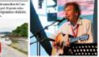
Alain Souchon père et fils en concert sur l'île de Bréhat.