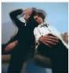
Un moment de la performance de Vincent D'Onofrio et Agnès Jaoui.

Le festival des Scènes de Bréhat, qui se déroule du vendredi 12 juillet au jeudi 18 juillet, est un événement culturel de haut niveau. Au programme, du théâtre, des concerts, de la danse. Avec notamment Agnès Jaoui, Vincent D'Onofrio, Pascale Casanovi, et de nombreux autres artistes. Le festival se déroule sur six jours, du vendredi au jeudi, de 12 heures à 20 heures. Les spectacles sont gratuits, mais les places sont payantes. Les billets sont disponibles sur le site du festival : www.scenesdebrehat.fr .