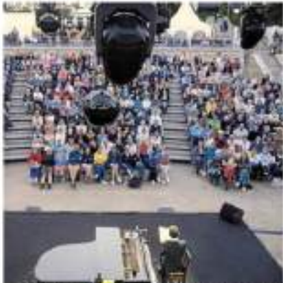
Le spectacle avec Vincent D'Onofrio et Agnès Jaoui lors d'un spectacle au festival des Scènes de Bréhat.

Du spectacle vivant, en vogue au en voilà : jusqu'à jeudi, les Scènes de Bréhat offrent théâtre, concerts et spectacles de qualité. L'atmosphère y est bon enfant et la magie opère chaque soir.