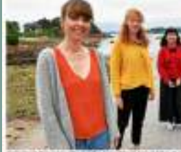
Les Fées Raillieuses, une animation de rue proposée par les Scènes de Bréhat.

L'ensemble de Bréhat « tous en scènes » prendra l'air sur l'île de Bréhat du 7 au 11 juillet, avec 22 spectacles, animations de rues, marionnettes, visites de l'île, animations de mer.