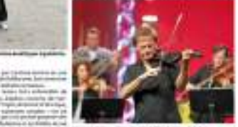
Le groupe Bodie en concert sur l'île de Bréhat.