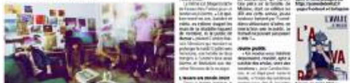
Un moment de la performance de Vincent D'Onofrio et Agnès Jaoui.

Le festival des Scènes de Bréhat, qui se déroule du vendredi 12 juillet au jeudi 18 juillet, est un événement culturel de haut niveau. Au programme, du théâtre, des concerts, de la danse. Avec notamment Agnès Jaoui, Vincent D'Onofrio, Pascale Casanovi, et de nombreux autres artistes. Le festival se déroule sur six jours, du vendredi au jeudi, de 12 heures à 20 heures. Les spectacles sont gratuits, mais les places sont payantes. Les billets sont disponibles sur le site du festival : www.scenesdebrehat.fr .