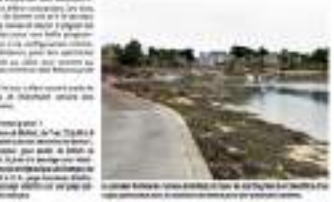
Le site de la Citadelle de Bréhat, lieu de tous les spectacles.

Le festival de Bréhat « tous en scènes » prendra l'air sur l'île de Bréhat du 7 au 11 juillet, avec 22 spectacles, animations de rues, marionnettes, visites de l'île, animations de mer. Le festival est organisé par les Scènes de Bréhat, une association qui a pour but de promouvoir la culture et les arts sur l'île de Bréhat. Les spectacles sont proposés par des artistes locaux et professionnels. Le festival est gratuit et ouvert à tous. Les billets sont disponibles sur le site des Vedettes de Bréhat. Le festival est financé par le conseil municipal de Bréhat et par des mécènes. Le festival est une véritable fête pour tous. Le festival est une occasion de découvrir de nouveaux talents et de soutenir les artistes locaux. Le festival est une véritable fête pour tous. Le festival est une occasion de découvrir de nouveaux talents et de soutenir les artistes locaux.