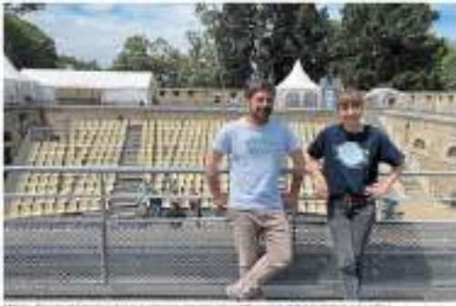
Arrière : Vincent D'Onofrio et Agnès Jaoui lors d'un spectacle au festival des Scènes de Bréhat.