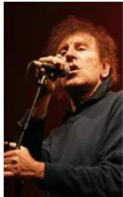
Alain Souchon sera en concert avec ses fils sur l'île de Bréhat, le mercredi 7 juillet, mais le concert est déjà complet.

Pratique Les Scènes de Bréhat, du 7 au 11 juillet ; infos sur les vedettes pour la traversée en période du festival sur le site des Vedettes de Bréhat.